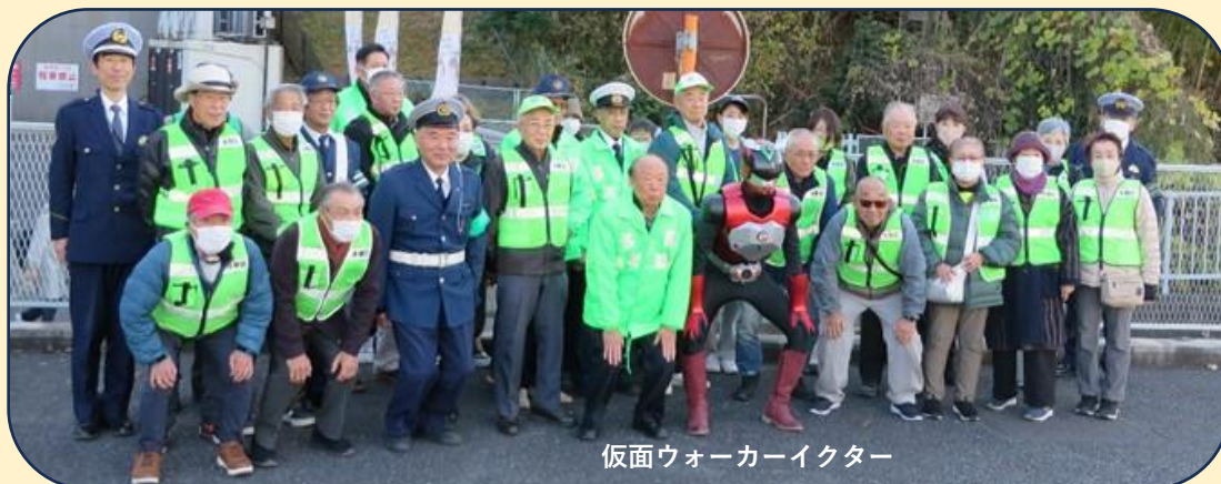
仮面ウォーカーイクター

令和7年12月11日、新百合ヶ丘駅南口において麻生警察署及び関係団体合同で「年末の交通事故防止運動キャンペーン」を実施し、「特殊詐欺防止・ワンワンパトロール」も同時に実施し交通安全啓発グッズを配りながら事故防止を呼び掛けました。